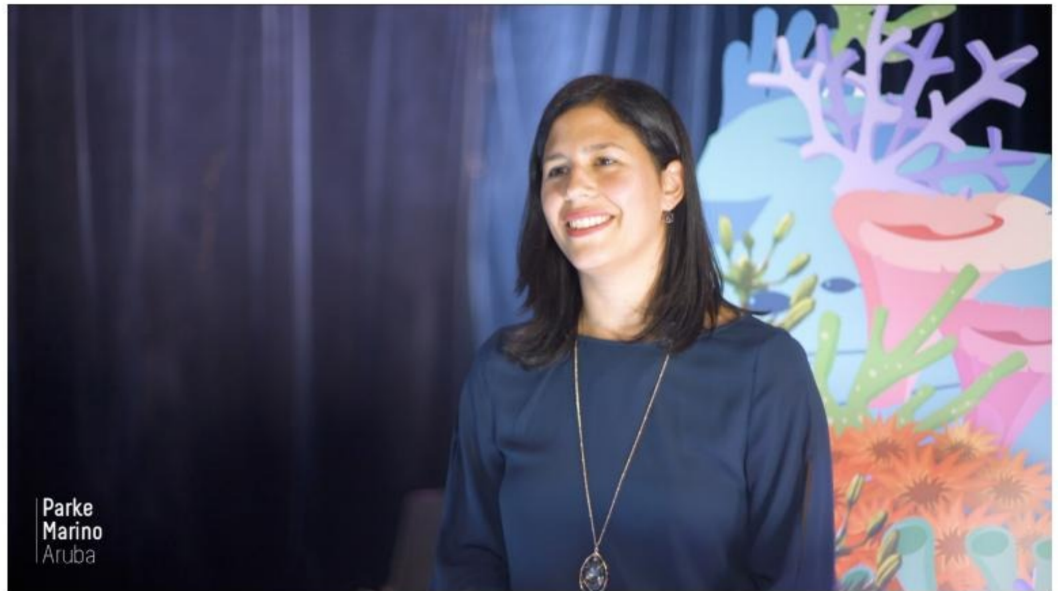
Parke Marino Aruba